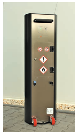
Ansicht der Rückseite