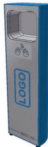
Bsp. für individuelles Design